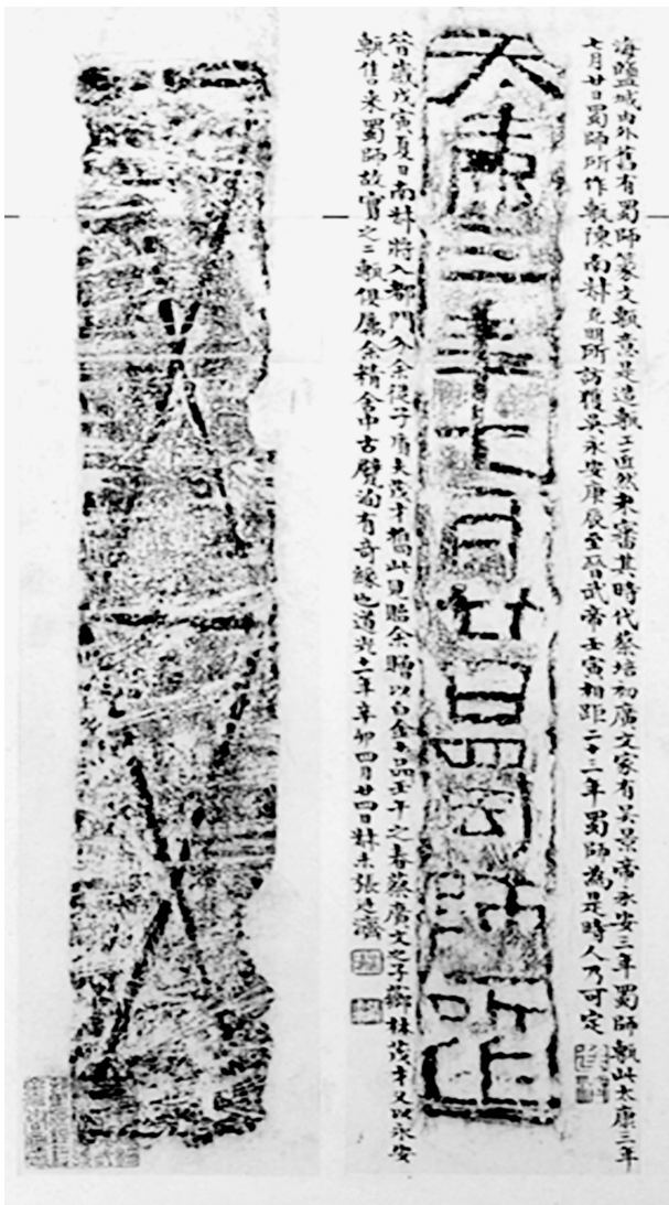
图2 “太康三年”蜀师砖

再看“太康三年”蜀师砖。张廷济《清仪阁所藏古器物文》中“晋太康蜀师砖”跋云：“此‘太康三年七月廿日蜀师所作’砖，陈南叔克明所访获” ② ，并著录有拓片（见图2）。阮元《两浙金石志》“晋太康砖”条云：“右三砖，一仁和赵茂才坦藏……一钱唐赵氏辑宁藏……一□□某氏藏，文曰‘太康三年七月廿日蜀师所作’十二字。此三砖皆出于临平山中。” ③ 其中的“□□某氏藏”蜀师砖，从铭文看，当即张廷济所说的“陈南叔克明所访获”者。因此可知陈南叔所得“太康三年”蜀师砖出自临平。